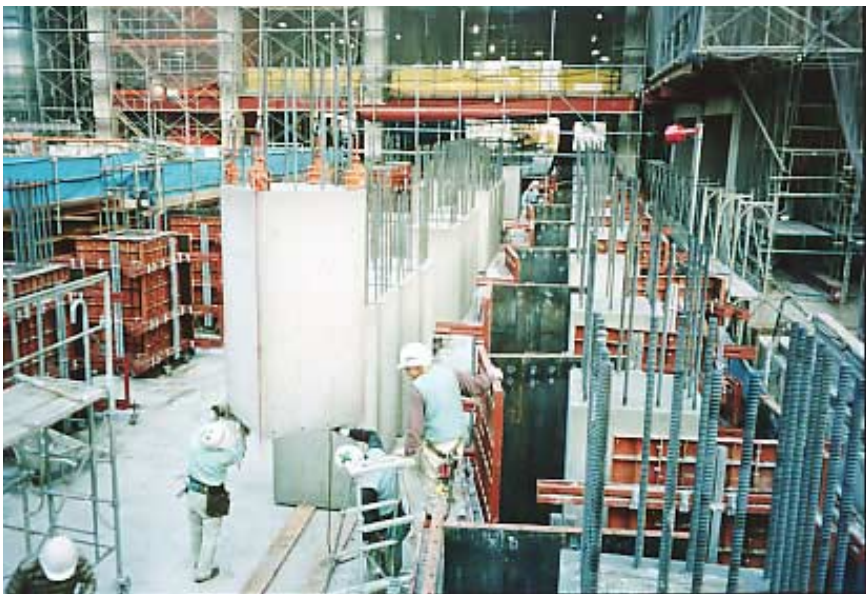
グラウト式鉄筋継手使用PCa柱

このような実績で培ったノウハウにより、カイザー部材だけでなく、超高層建物などのフルPCa製の柱、梁の製造にも活かされ、施工の合理化、施工品質の安定的保持に威力を発揮しています。